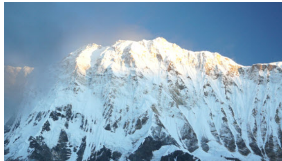
Face sud de l'Annapurna depuis ABC