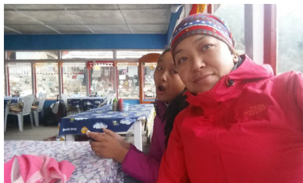
BC de Mardi Himal à 3600 m